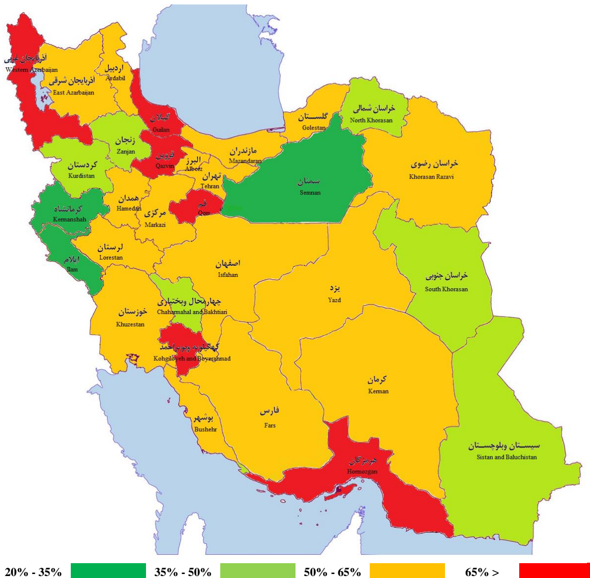
شکل ۲- اطلس فقر غذایی برای مناطق شهری ایران در سال ۱۴۰۱ Figure 2- Atlas of food poverty for urban areas of Iran in 2022

برخوردار است ۱ . نتایج حاصل از برآورد مدل لاجیت نشان می‌دهد که متغیرهای سن سرپرست خانوار، بعد خانوار، تنوع غذایی، وضعیت اشتغال، ساعت کار سرپرست خانوار، یارانه دریافتی خانوار، درآمد خانوار و تنوع غذایی بر امنیت غذایی خانوارها اثر معنی‌دار داشته‌اند.