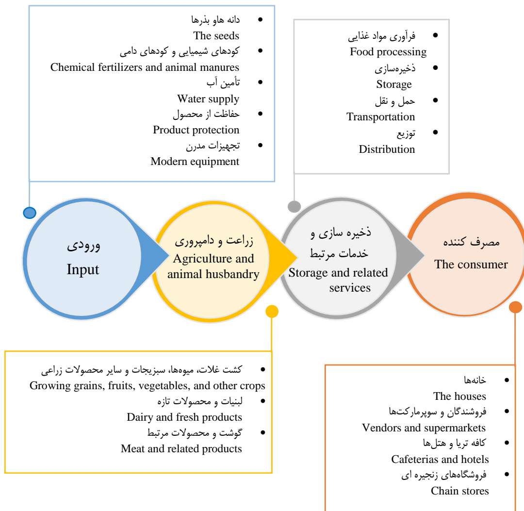
شکل ۱- تأثیرات همه‌گیری کووید-۱۹ بر سیستم‌های کشاورزی (Sridhar et al., 2022)

سیاست‌های فاصله‌گذاری اجتماعی و قرنطینه مدنی برای جلوگیری از گسترش ویروس روی آورده‌اند. تأثیر بازداشتن افراد از توانایی کار و فعالیت، ملاقات و معاشرت به شدت به فعالیت‌های اقتصادی، به‌ویژه در بخش خدمات و کشاورزی آسیب وارد کرده است (Barichello, 2020). کشاورزی به‌عنوان بخش مهمی از اقتصاد جهان شناخته شده که عمدتاً در کشورهای در حال توسعه، نقش حیاتی دارد و نیازهای اصلی