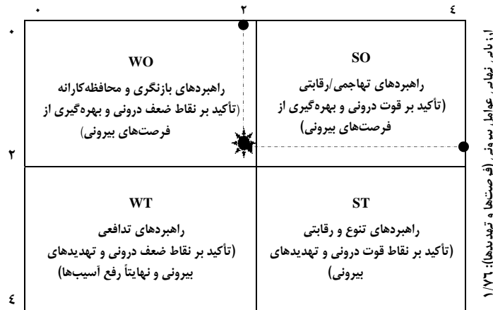
شکل ۱- ماتریس نمره نهایی ارزیابی عوامل داخلی و خارجی