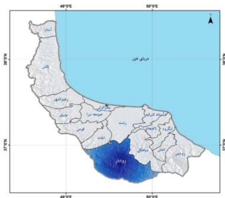
شکل ۲- موقعیت جغرافیایی رودبار در استان گیلان (GSMEI, 2019) Figure 2- Geographical location of Rudbar county in Gilan province

قرارگرفت. اعضای نمونه‌آماری از میان شالی کاران بخش‌های رحمت آباد و بلوکات (که از نظر وسعت بزرگترین بخش‌های این شهرستان به