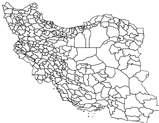
شکل 1- تقسیمات سیاسی شهرستان‌های ایران Figure 1- Political divisions of Iran counties

بررسی تخصیص زمین بین گروه‌های محصولات سالانه زراعی در واقع بررسی سهم زمین هر کدام از این گروه‌ها می‌باشد. سهم‌ها در واقع یکسری متغیرهای کسری بین صفر و یک می‌باشند که این امر لزوم بکارگیری مدل‌های کسری را نشان می‌دهند. از آنجایی که تعداد گروه‌های محصولات سالانه زراعی بیش از دو مورد می‌باشد لازم است که مدل مورد استفاده از نوع مدل‌های کسری چندگانه باشد که مطالعه حاضر با توجه به ادبیات موضوع و پیشینه تحقیق بکارگیری مدل لاجیت چندگانه کسری را مدنظر قرار داده است. جهت برآورد مدل لاجیت چندگانه کسری از اطلاعات زراعی و هواشناسی مربوط به شهرستان‌های کل کشور استفاده خواهد شد. اطلاعات زراعی از